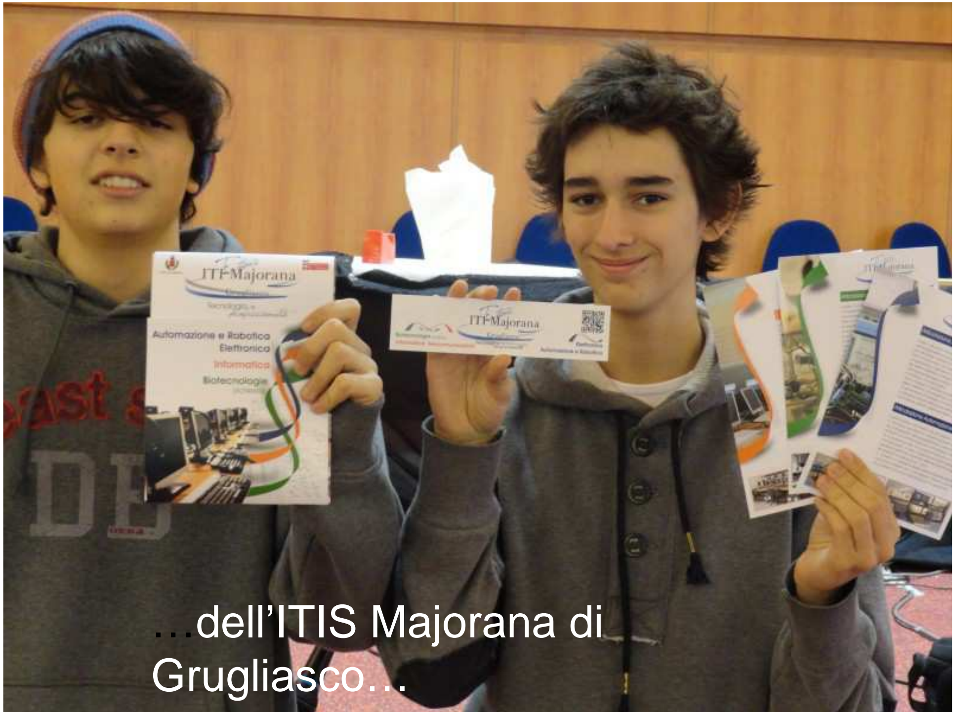
...dell'ITIS Majorana di Grugliasco...